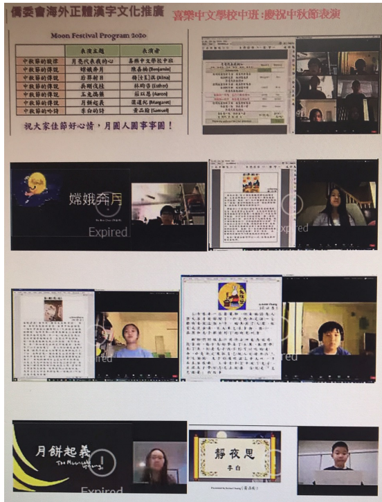
2020-Q3 中班 中秋節說故事比賽