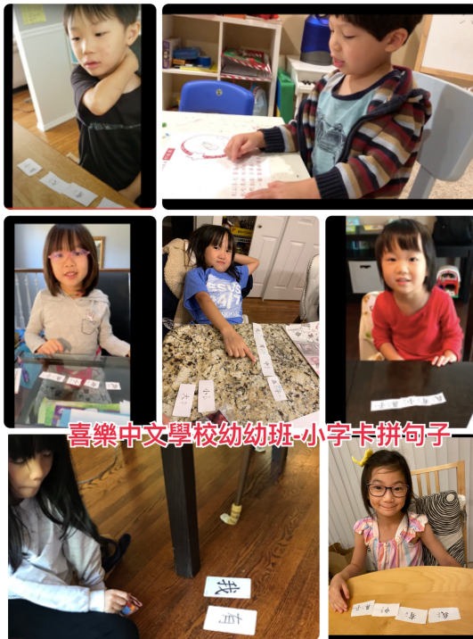
2020-Q3 小小班 小字卡拼句子

雖然，今年不能像往年那樣舉辦中秋節聚餐和晚會，但也發掘出另類且別出心裁的慶祝方式。