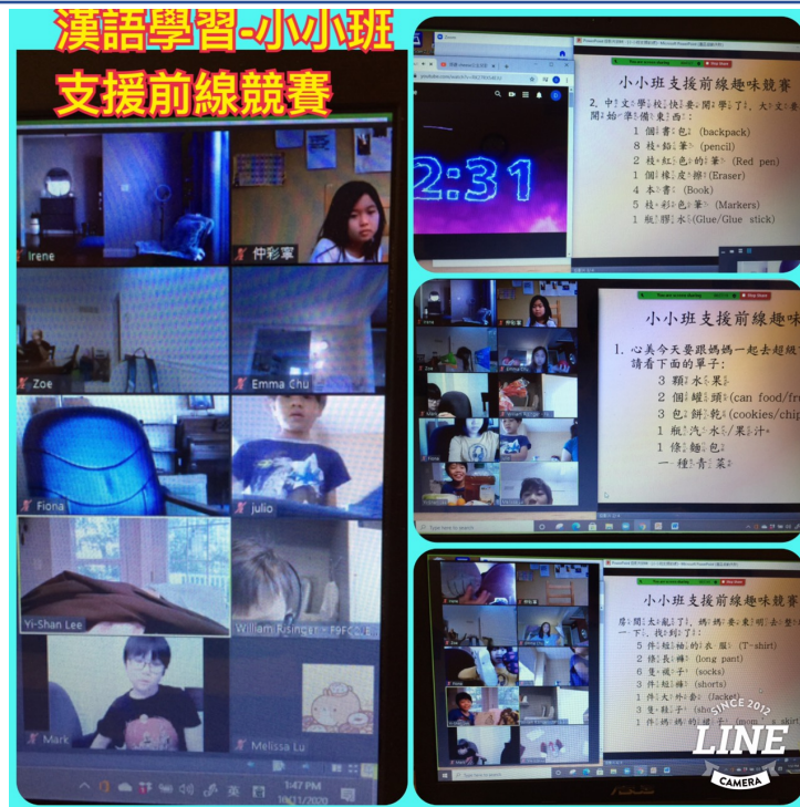
2020-Q3 小小班 支援前線競賽