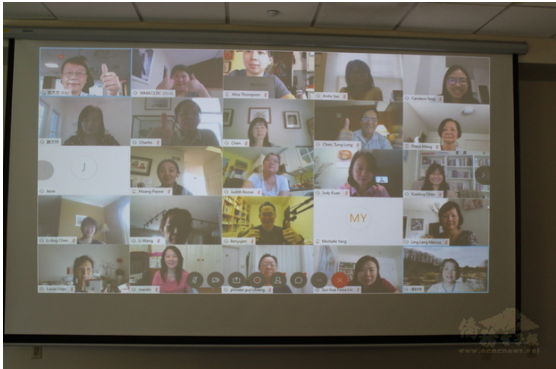
大華府地區2020年華文教師線上研習會學員合影。