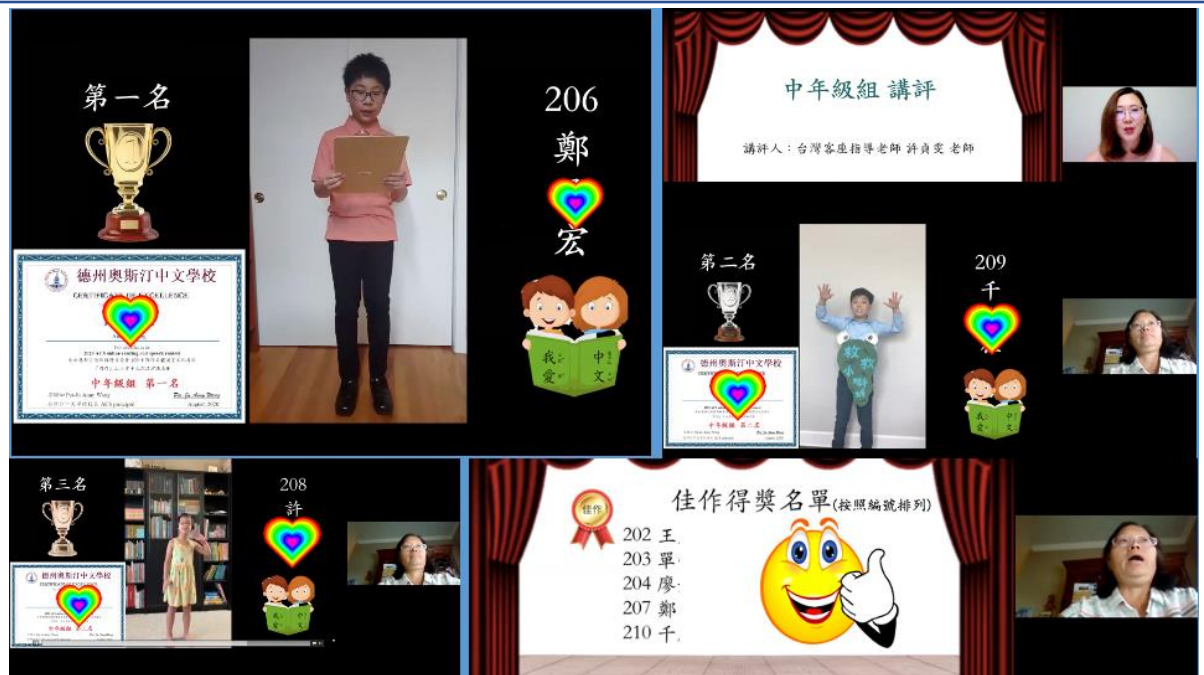
「朗朗」上口秀中文朗讀演講比賽頒獎典禮中年級組得獎名單