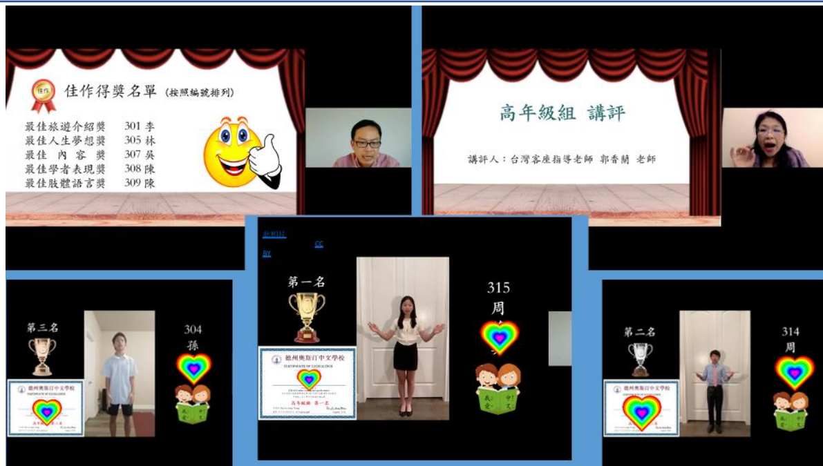
「朗朗」上口秀中文朗讀演講比賽頒獎典禮高年級組得獎名單