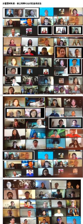
2020年全美中文學校聯合總會年會教師及學藝競賽得獎學生合影留念