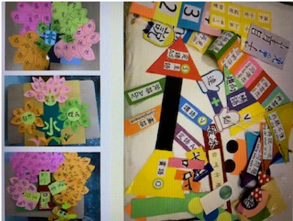
7/18 翻轉教學教具製作

所有參與的教師們也經由本次學習而收穫滿滿，充實了自身的教學資料庫，也都躍躍欲試的期待著秋季開學後能嘗試創新的教學。美西北區華文學校聯誼會也感謝參與教師們的熱誠與鼓勵，更感謝文教中心主任與同仁的協助，順利完成這兩場研習。