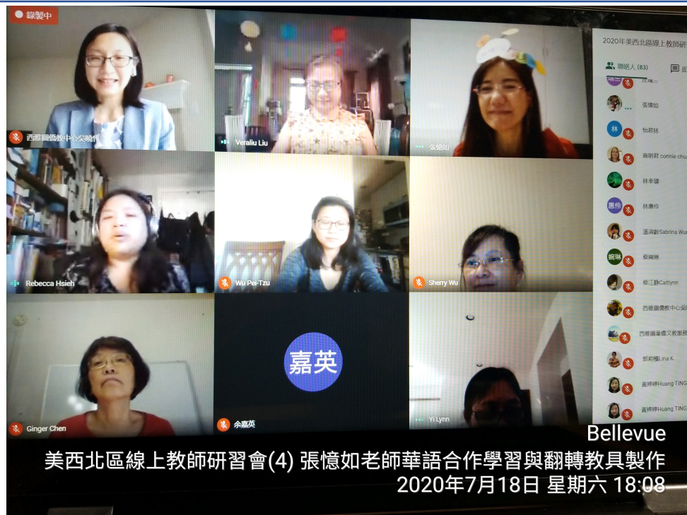
7/18 翻轉教學教具製作