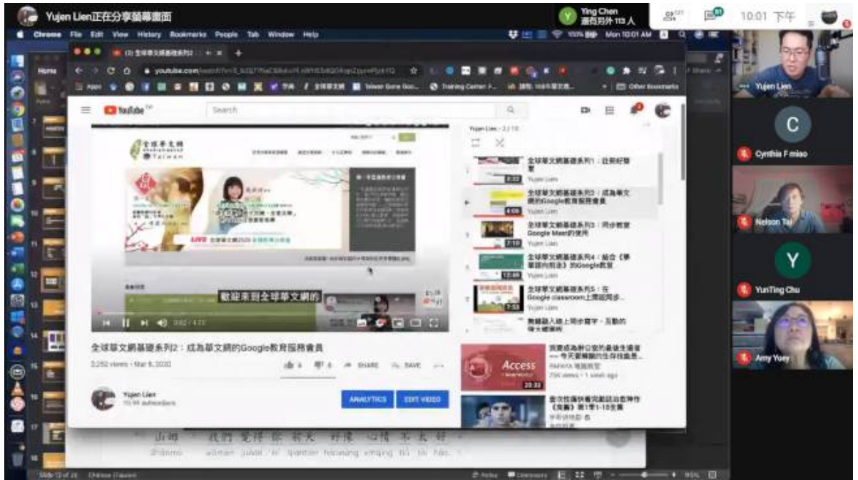
研習會的教學過程