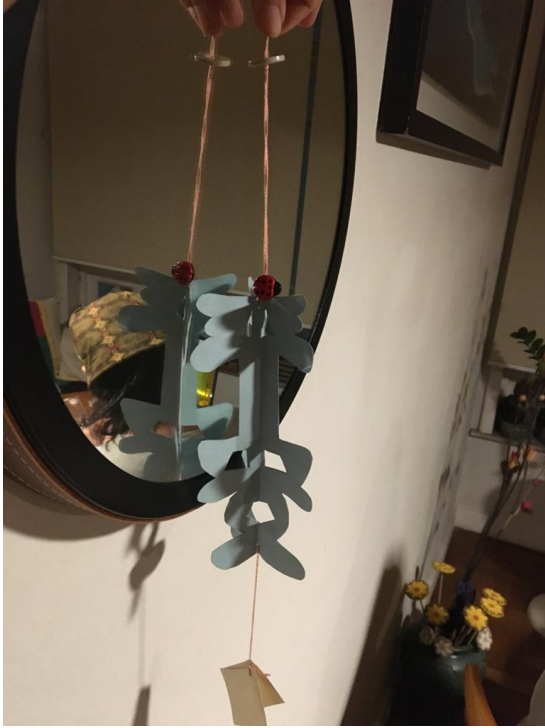
平安字吊飾製作體驗