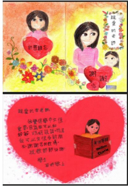
中學組 6-8 年級：第一名 馮若妤 Zoie Feng (南加州中文學校聯合會- 核桃孔孟中文學校)