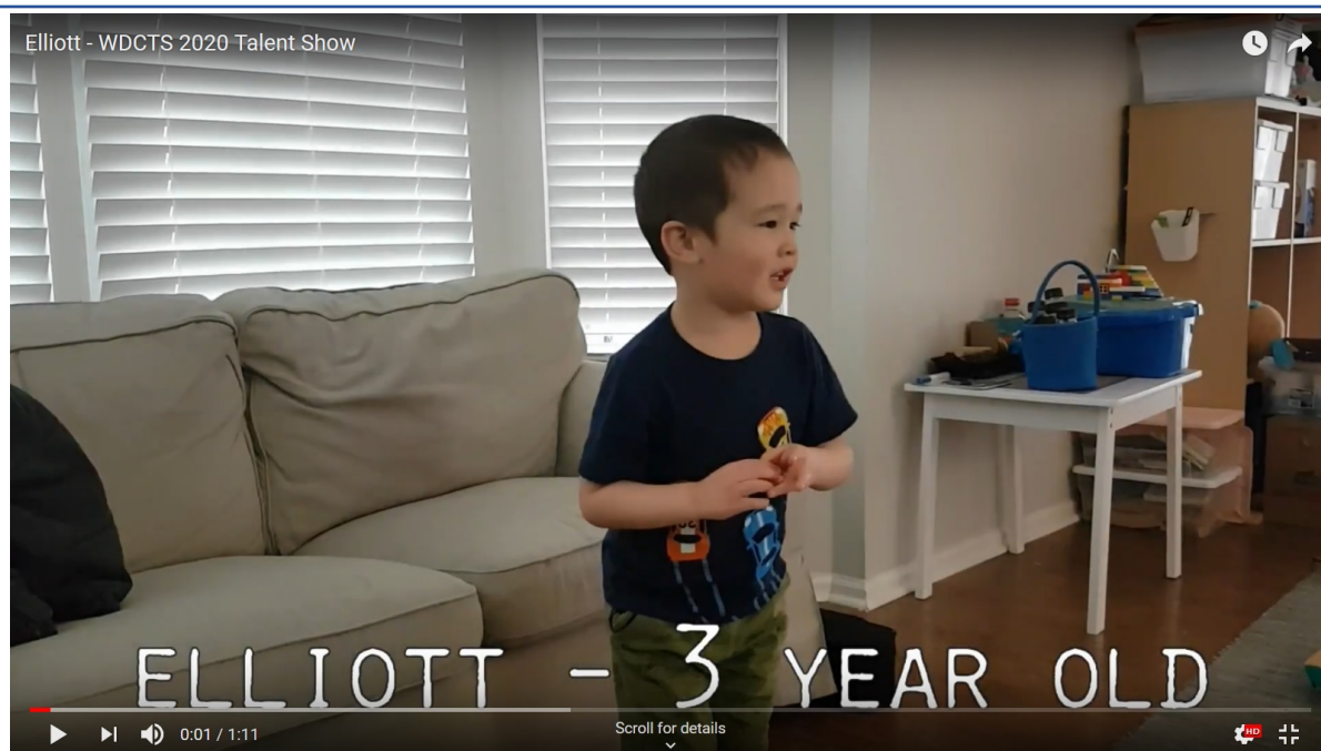
低年級組趣味表演