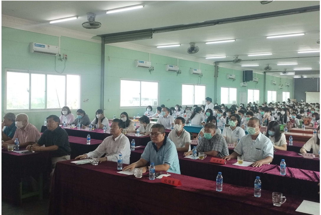
孔教東區比賽現場