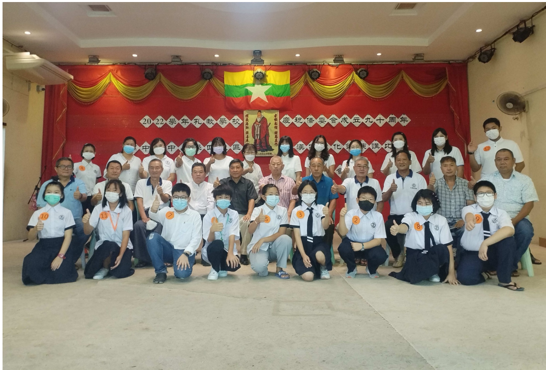
小學組參賽同學們與校領導、主任老師們合照