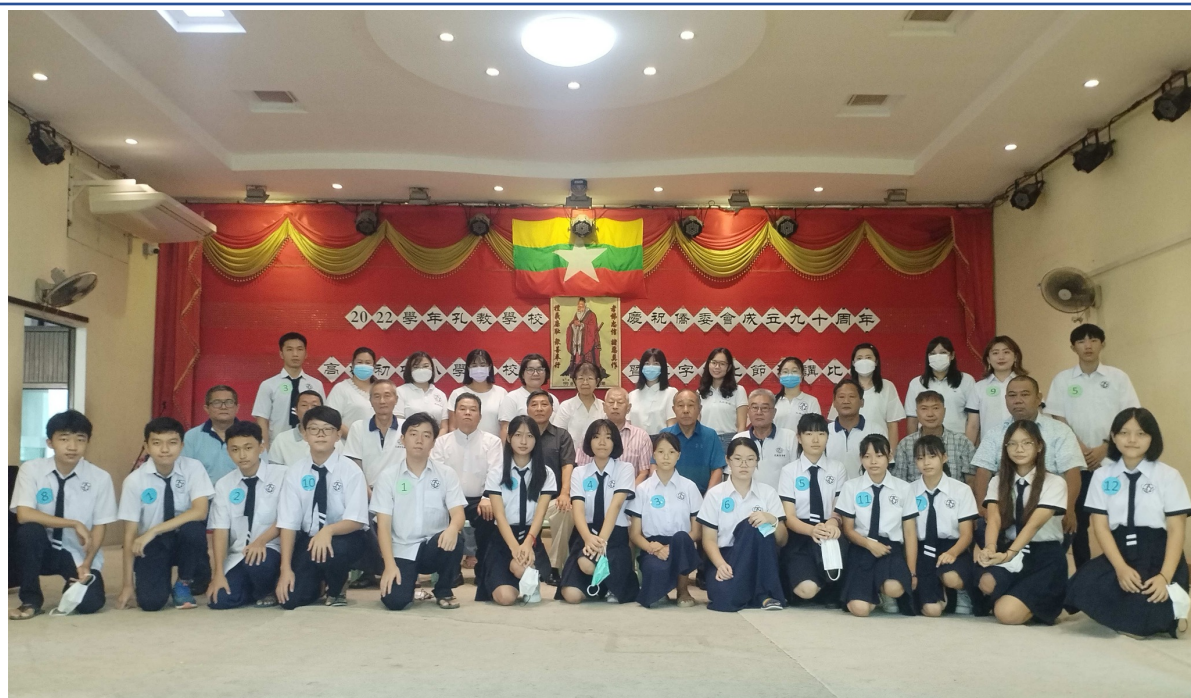
初中組、高中組參賽同學們與校領導、主任老師們合照